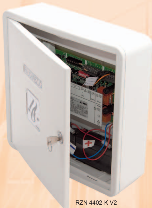
RZN 4402-K V2